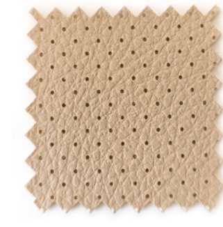
MICROPERFORADO Bajo pedido / Upon request