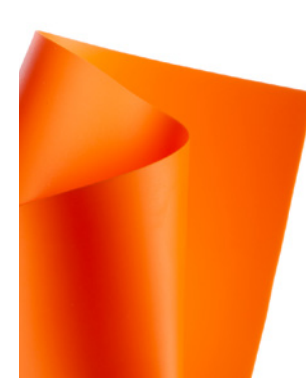
Naranja / Orange 120 cm x 50 m