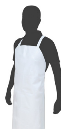
Translúcido / Translucent 120 cm x 50 m