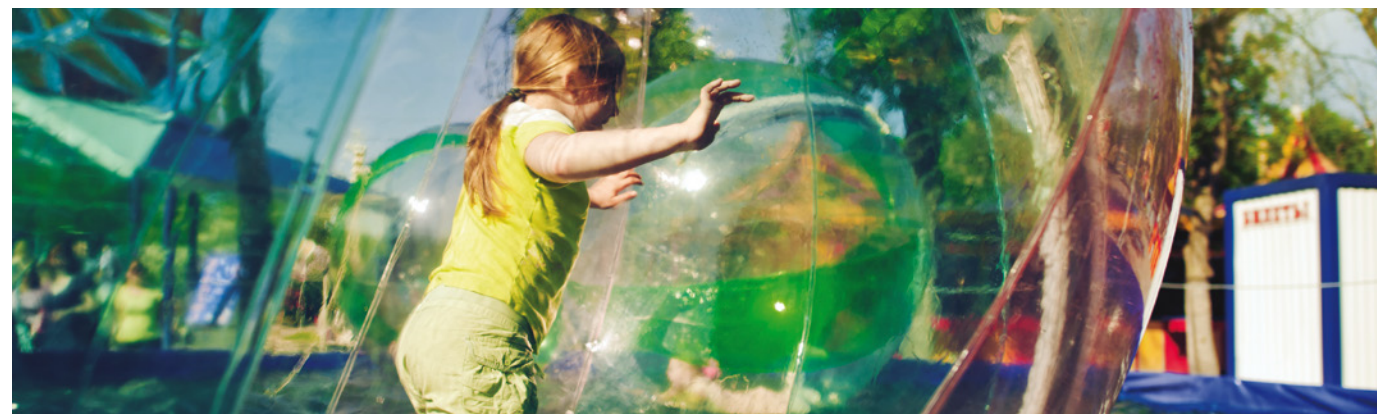
Transparent / Clear 120 cm x 25 m