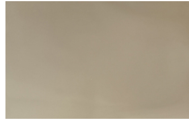
Oro / Gold 137 cm x 50 m