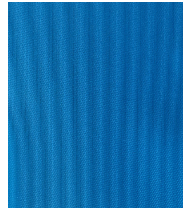
Azul / Blue 148 cm x 50 m