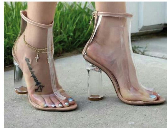
Cristal / Clear 120 cm x 50 m