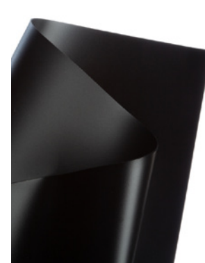
Negro / Black 120 cm x 50 m