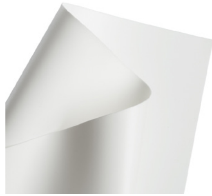
Blanco / White 140 cm x 100 m