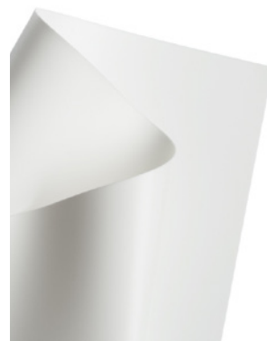
Blanco / White 120 cm x 50 m