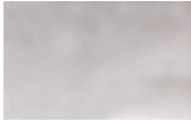
Plata / Silver 137 cm x 50 m