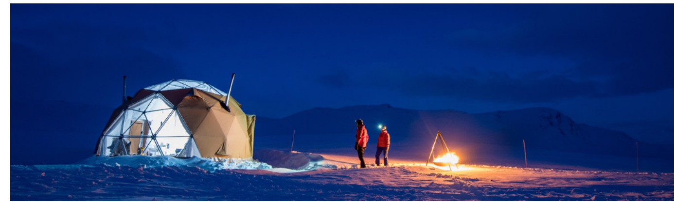
Transparent / Clear 120 cm x 50 m