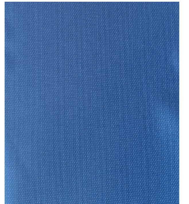
Marino / Marine 148 cm x 50 m

*Otros colores bajo pedido · Other colors upon request